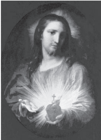
Die Herz-Jesu-Verehrung prägte eine wichtige Zeit katholischer Volksfrömmigkeit.

«Die Sünden der Menschen müssten uns mit tiefem Schmerz erfüllen und sollten uns zur Sühne anspornen. Wir sollten das gottmenschliche Herz des Erlösers zu trösten suchen durch unsere Opferbereitschaft im Beruf und unsere Liebe zu den Seelen..., für deren Rettung Jesus seinen letzten Blutstropfen hingegeben hat. In Vereinigung mit seinem Opfer am Kreuze sollte unser ganzes Leben ein Sühn- und Brandopfer werden für die Seelen. Wir alle haben unseren Teil an Sühne zu leisten...»