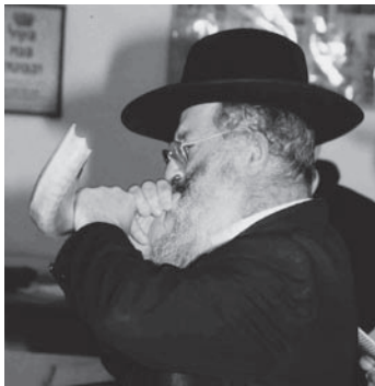
Beim Yom Kippur-Fest wird im Gottesdienst mehrmals das Shofar geblasen.