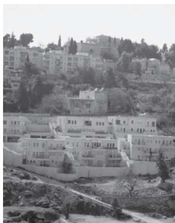
Bildmitte: «Beit Catarina» in Abu Tor, Jerusalem, bietet u.a. auch ein Dach für das Büro des Jerusalemprojektes.

Religionen ebenso wie neue Wirtschaftsformen, Gesundheitszentren, Kunstinitiativen und Bildungsinstitutionen genutzt würden, um zum Weltfrieden beizutragen?